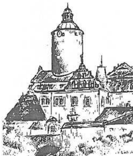
Rys. Alicja B. Kamińska

W latach 1329-1346 bastion był posiadłością księcia Henryka I Jaworskiego. Po śmierci Henryka sukcesję po nim obejmuje jego bratanek, Bolko Świdnicki. W 1372 r. księstwo i zamek jako lenno koronne zostają włączone do Czech. W 1434 r. zamek zdobywają husyci. Rezydowali tu również rycerze rozbójnicy – raubritterzy. W XVI wieku właścicielem zamku zostaje łżycki ród von Nostitz, który włada nim przez dwa i pół wieku. W 1792 r. zamek zostaje mocno spalony. Później przechodzi w ręce innego łżyckiego rodu – Uchtritzów. W latach 1909/1914 niemiecki historyk i konserwator zabytków Bodo Ebhardt przeprowadza gruntowną rekonstrukcję, konserwację i modernizację obiektu. Został on odrestaurowany, lecz niestety odbyło się to kosztem niszczenia autentycznych pozostałości minionych okresów. Ponadto rzeka Kwisa, po wybudowaniu w latach 1904/1905 zapory i elektrowni wodnej, utworzyła tu zalewowe Jezioro Leśniańskie, co spowodowało zmianę otoczenia posiadłości. W 1945 r. jej użytkownikiem zostaje Lubańskie Starostwo Powiatowe, później Dolnośląska Izba Rolnicza, a po 1952 r. Ministerstwo Obrony Narodowej, które organizuje w nim Wojskowy Dom Wypoczynkowy.